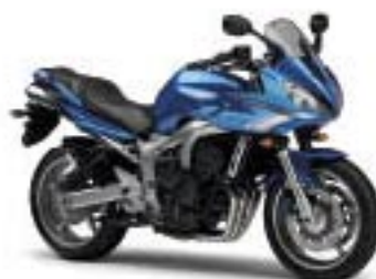
FZ6 Fazer S2/ABS – Power Blue (BMC)