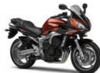
FZ6 Fazer S2/ABS – Autumn Orange (DOM7)