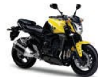
FZ1/ABS – Extreme Yellow (RYC1)

FZ1 ABS, la FZ1 no equipa quilla de serie.