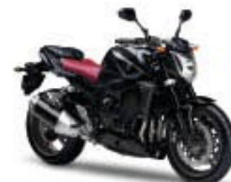
FZ1/ABS – Graphite (DNMG)