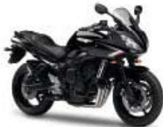
FZ6 Fazer S2/ABS – Midnight Black (SMX)