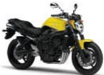
FZ6 S2/ABS – Extreme Yellow (RYC1)