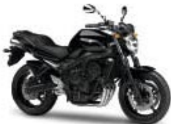
FZ6 S2/ABS – Midnight Black (SMX)