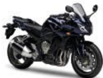
FZ1 Fazer/ABS – Ocean Depth (DPBMU)