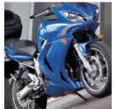
FZ1 Fazer ABS y FZ6 Fazer S2 ABS equipadas con accesorios genuinos GT Yamaha.