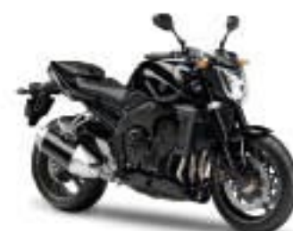
FZ1/ABS – Midnight Black (SMX)