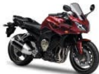
FZ1 Fazer/ABS – Lava Red (DRMK)