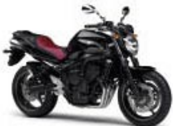
FZ6 S2/ABS – Graphite (DNMG)