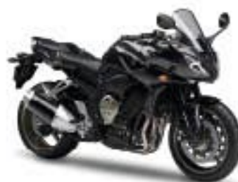
FZ1 Fazer/ABS – Graphite (DNMG)